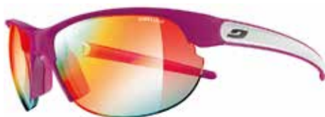
139,95 € | JULBO Breeze