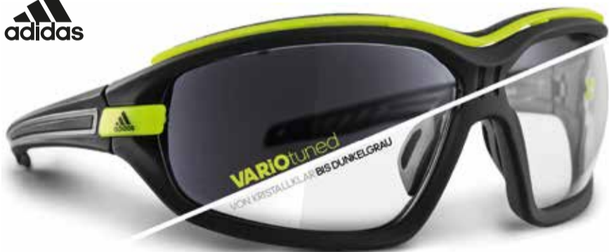
249,00 € | adidas EVIL EYE EVO PRO mit farbveränderlichen Gläsern